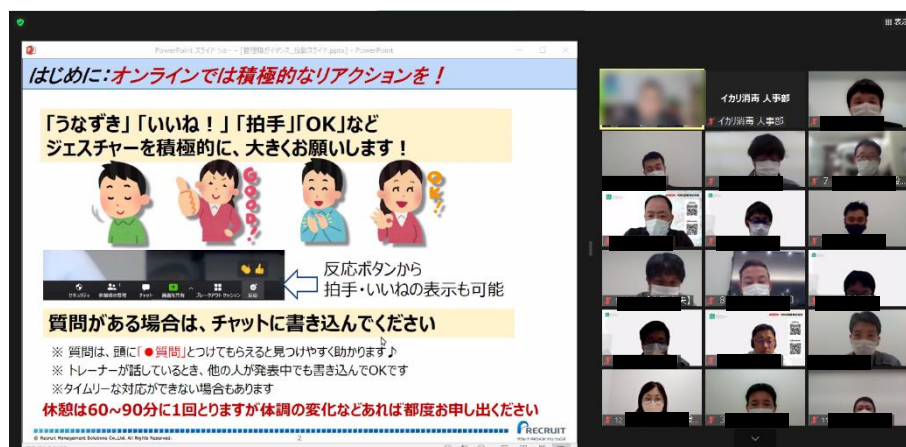
👉 管理職ガイダンスの様子

4月20日にOJTトレーナー研修、4月21日に管理職ガイダンスが行われました！ OJTトレーナー研修は、4月に入社した新入社員のOJTトレーナーになる社員を対象に、育成者の役割や、新人育成のポイントなどを学ぶことができます！管理職ガイダンスでは、新入社員の向上に向けて、組織で一貫した育成を行うことを目的として、OJTトレーナー研修の内容を共有し、新人育成について改めて学ぶことができます。新社員が入ってくる責任感からか、みなさん真剣に聞いていました！