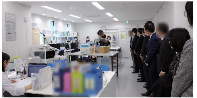
👉ITC 中の様子④(微生物検査課) 微生物検査課が ITC にお引越ししました！