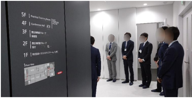
👉ITC 中の様子① (研修 2 日目) 綺麗な施設でワクワクしますね！