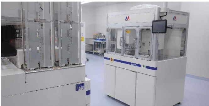
👉ITC 中の様子⑤(微生物検査課) 新しい検査機器も沢山導入されていました👁👁