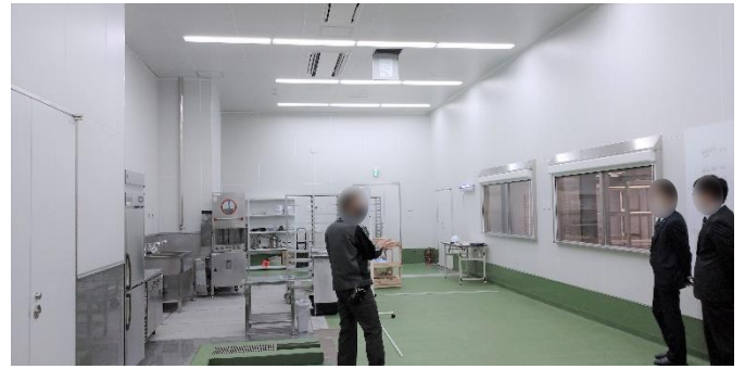
👉ITC 中の様子② 食品工場に似せた作りになっており、より現場に近い環境で防除技術を学ぶことができます！