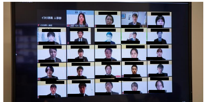
👉 内定式の様子 ①