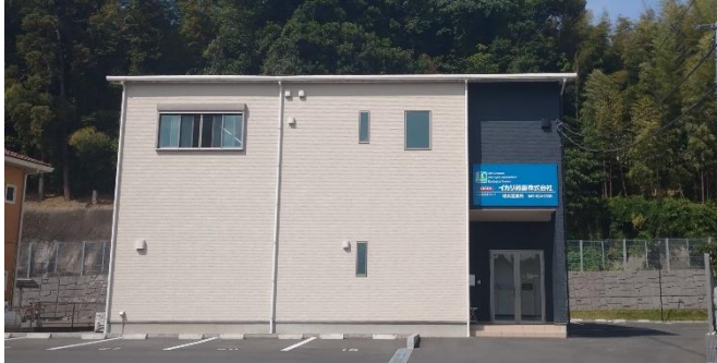
👉横浜営業所の外観