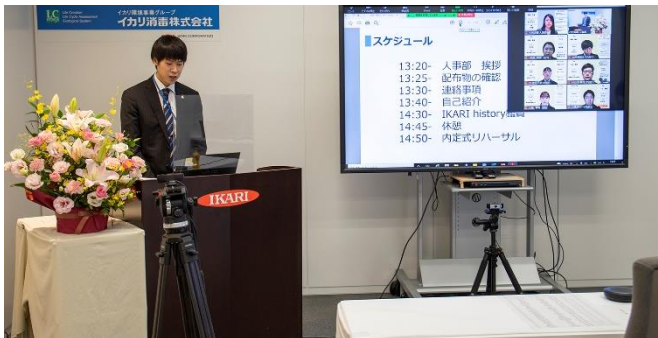
👉 オリエントーションの様子